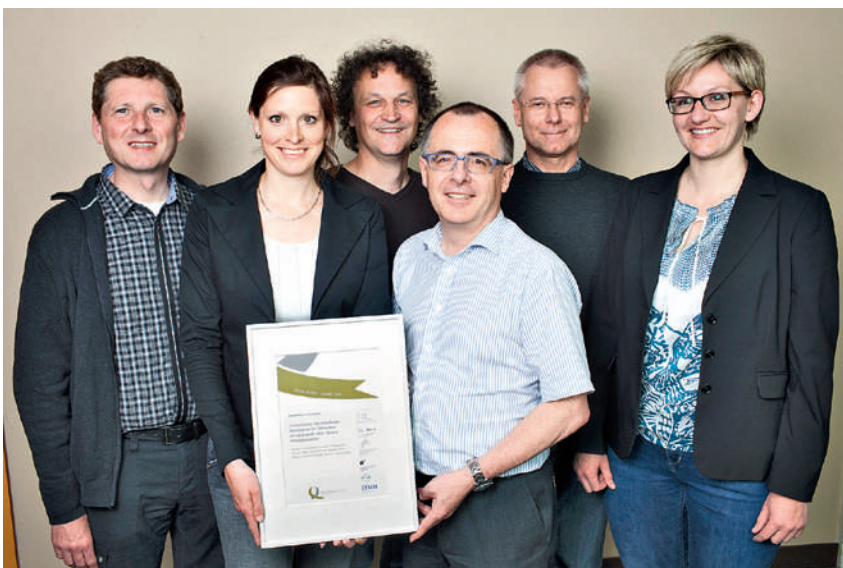
Gewinnerteam der Kategorie «Management» des Swiss Quality Awards 2012.

Der Patientenmanager ist Bindeglied und Mediator im Reha-Team.